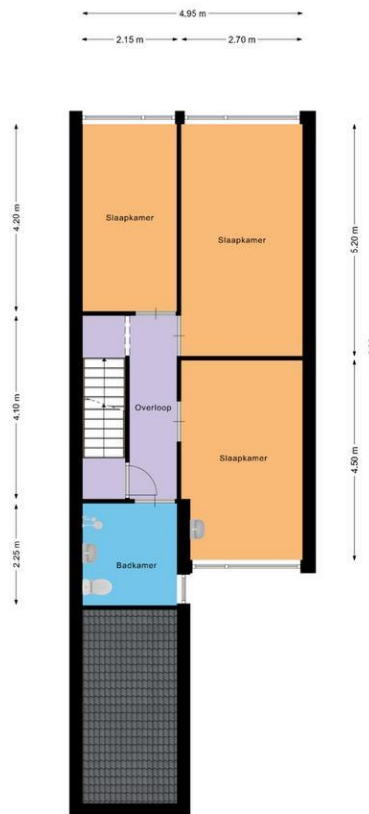
De Eik 3 Almelo

De plattegronden zijn geproduceerd voor promotionele doeleinden en ter indicatie. Aan de plattegronden kunnen geen rechten worden ontleend.